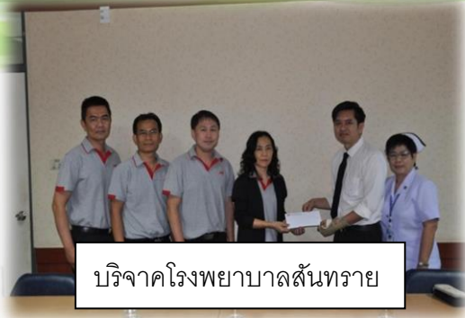
บริจาคโรงพยาบาลสันทราย