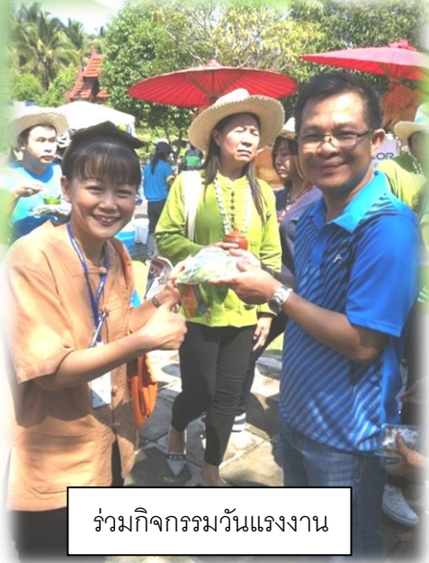
ร่วมกิจกรรมวันแรงงาน