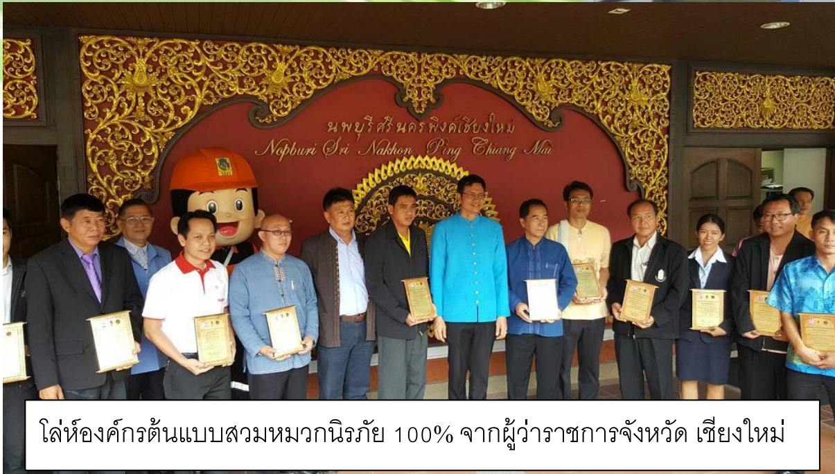
โล่ห้องค์กรต้นแบบสวมหมวกนิรภัย 100% จากผู้ว่าราชการจังหวัด เชียงใหม่