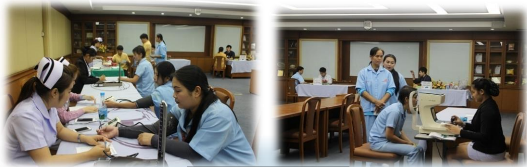
ตรวจสอบภาพประจำปี