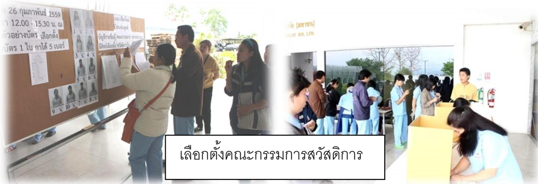
เลือกตั้งคณะกรรมการสวัสดิการ

Cm มุ่งทำให้ถูกต้องตั้งแต่แรกในทุกๆ ด้าน ตลอดจนการปฏิบัติตามกฎหมายที่เกี่ยวข้อง เช่น การเลือกตั้งคณะกรรมการสวัสดิการฯ คณะกรรมการความปลอดภัยฯ การตรวจสอบภาพประจำปีพนักงาน การฝึกซ้อมดับเพลิง และหนีไฟ เป็นต้น