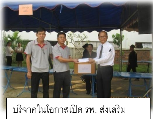
บริจาคในโอกาสเปิด รพ. ส่งเสริม