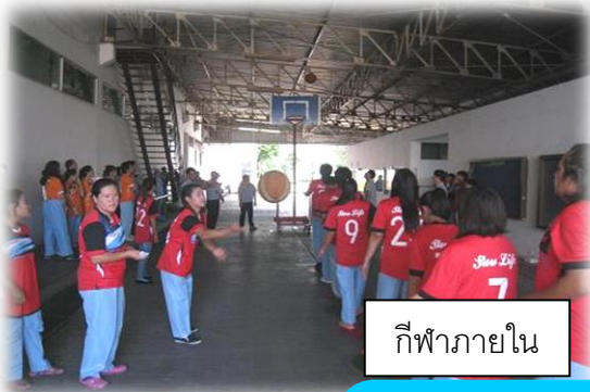
กีฬาภายใน

Cm ร่วมสร้างความสัมพันธ์ที่ดีระหว่างพนักงานด้วยการจัดกิจกรรมกีฬา สัมพันธ์ กีฬาฮาเฮ ให้ได้เล่นผ่อนคลายจากการทำงาน กิจกรรมเพื่อนช่วย เพื่อน ตลอดจนการสนับสนุนบุตรพนักงานให้ได้รับการศึกษาที่ดีขึ้นด้วยการ ให้ทุนการศึกษาอย่างต่อเนื่องทุกปี