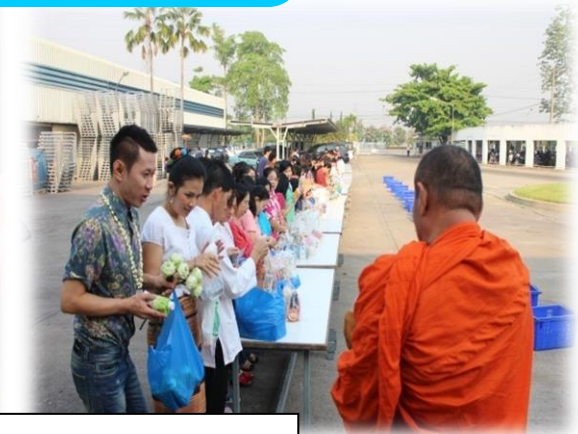
ร่วมทำบุญในโอกาสวันสำคัญ