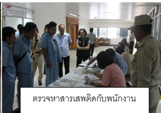
ตรวจหาสารเสพติดกับพนักงาน