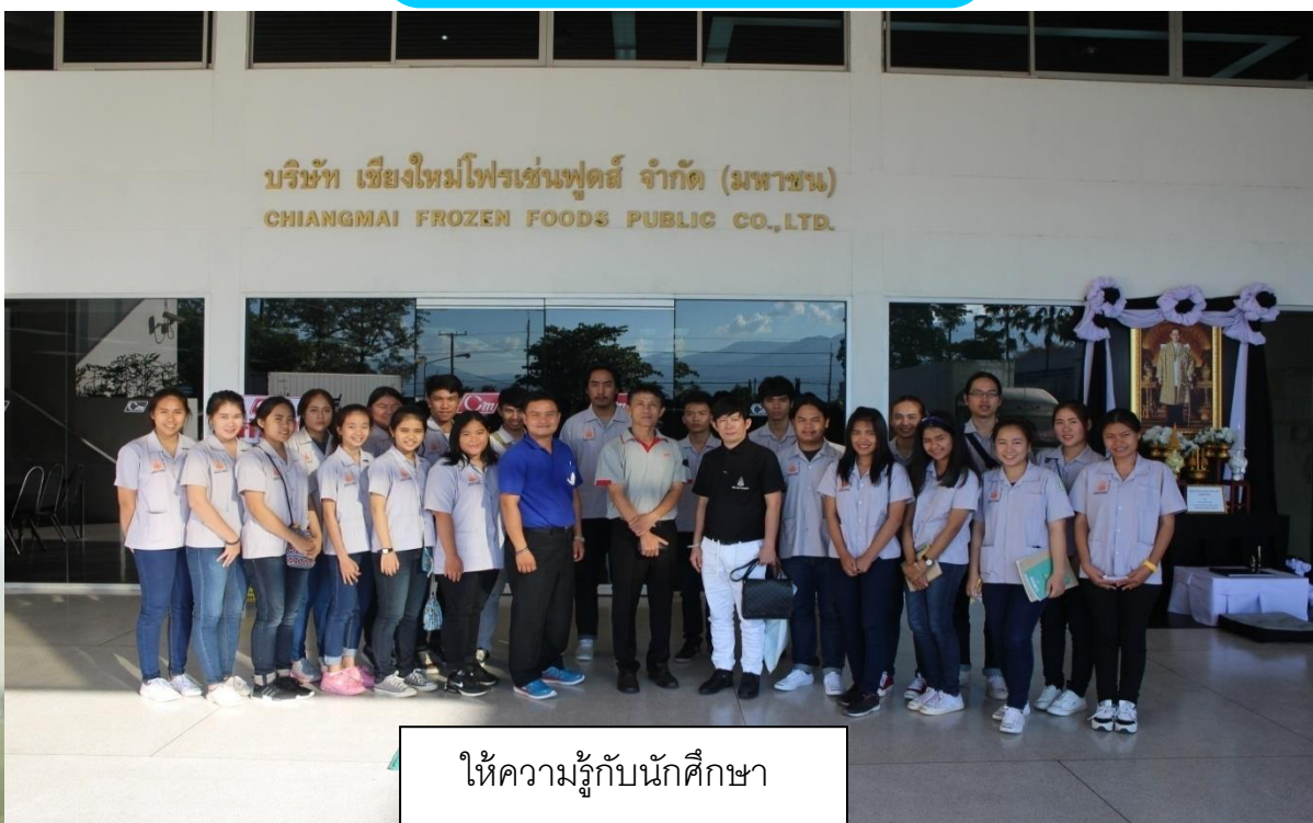
ให้ความรู้กับนักศึกษา