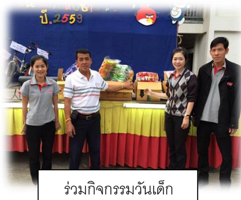
ร่วมกิจกรรมวันเด็ก