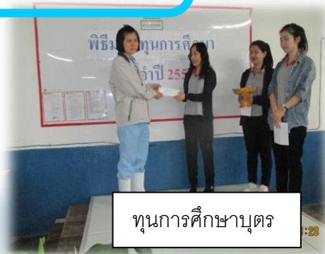
ทุนการศึกษาบุตร