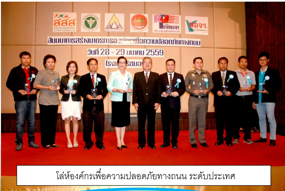
โล่ห้องค์กรเพื่อความปลอดภัยทางถนน ระดับประเทศ