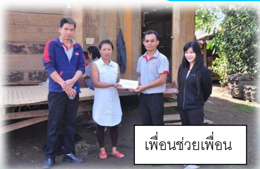
เพื่อนช่วยเพื่อน