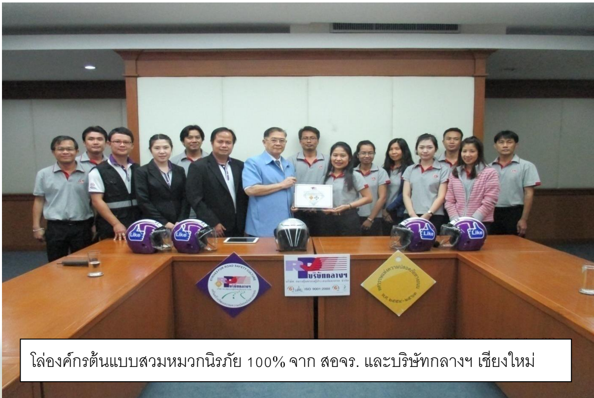
โล่องค์กรต้นแบบสวมหมวกนิรภัย 100% จาก สจร. และบริษัทกลางฯ เชียงใหม่

Cm ให้ความสำคัญในการดูแลพนักงานงานให้มีความปลอดภัย ทั้งในการทำงานและนอกเวลางาน โดยได้ร่วมทำกิจกรรมองค์กรต้นแบบสวมหมวกนิรภัย 100% ให้พนักงานเดินทางมาทำงาน และในชีวิตประจำวันอย่างปลอดภัย