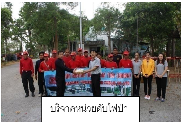
บริจาคหน่วยดับไฟป่า