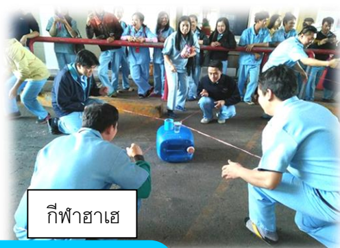
กีฬาฮาเฮ